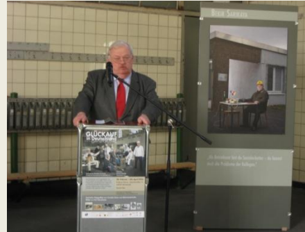
Recklinghausen 1. Mai