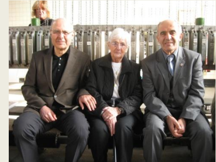
Glückauf trifft Onkel Hasan