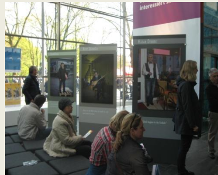
Auf Zollern Bövinghausen