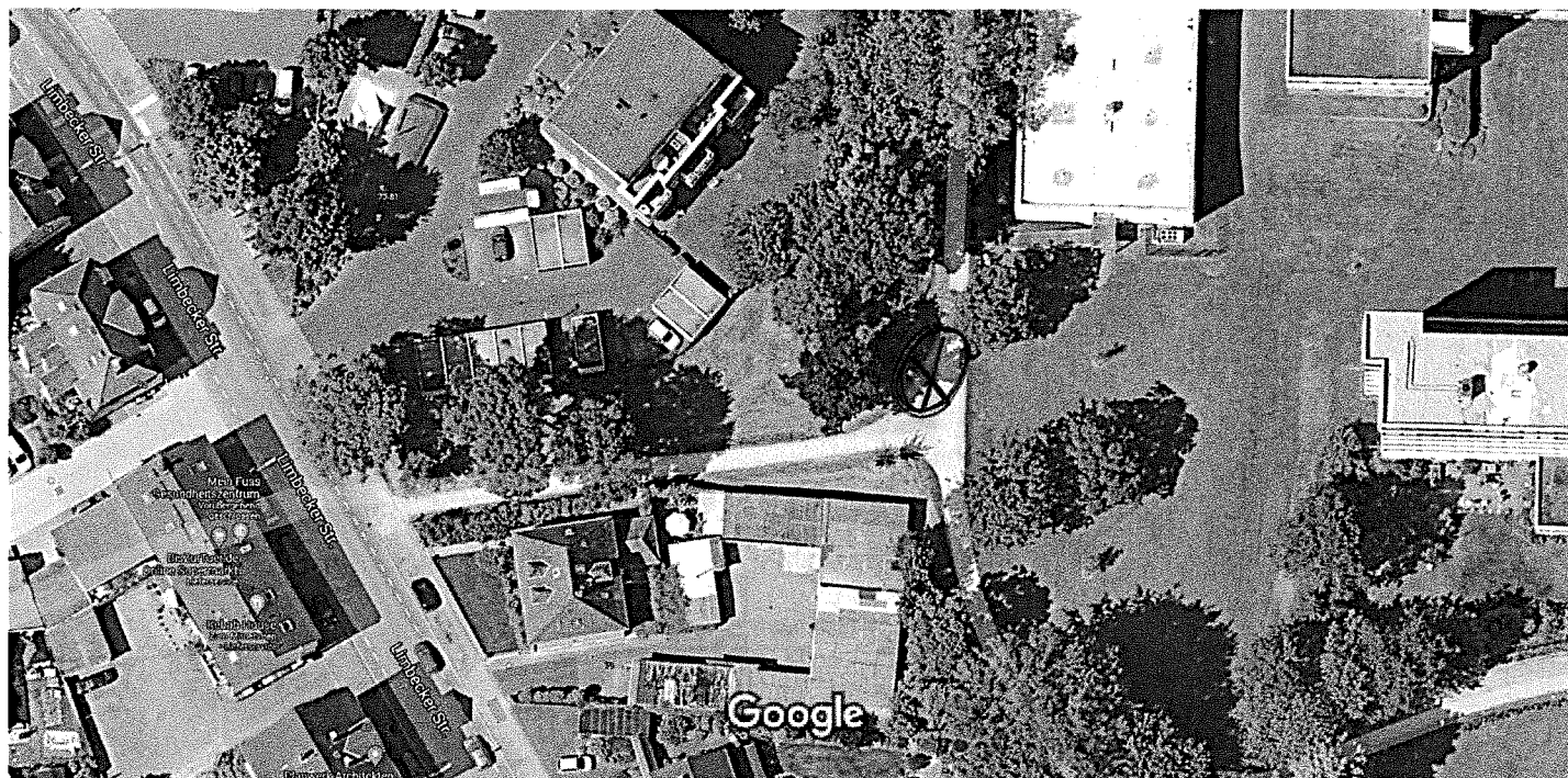
Bilder © 2021 AeroWest,Maxar Technologies,Kartendaten © 2021 GeoBasis-DE/BKG (©2009) 10 m