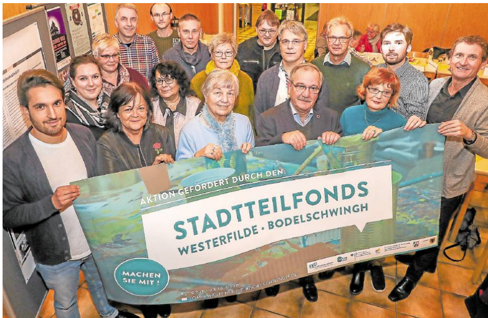
Die Stadtteilkjury entschied über fünf neue Projekte in Westerfilde und Bodelschwingh.