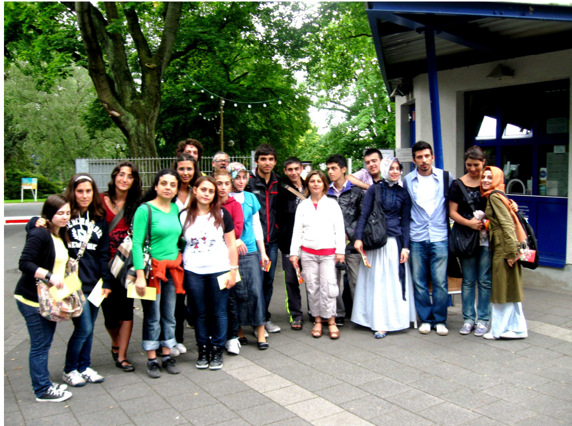
Big Tipi - Work-Camp 2011 Besucher aus Beyoglu besuchen den Westfalenpark