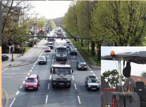
Geschwindigkeitsreduktion und LKW-Nachtfahrverbot auf der B1