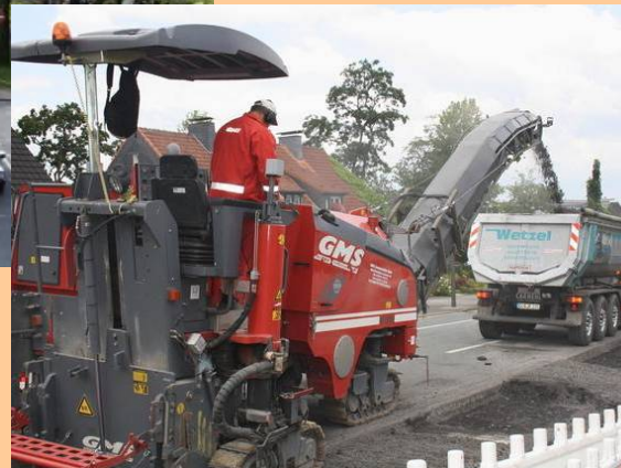
Einbau lärmoptimierten Asphalts (LOA5D)