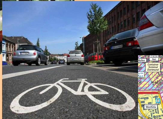
Ausbau des Radwegenetzes