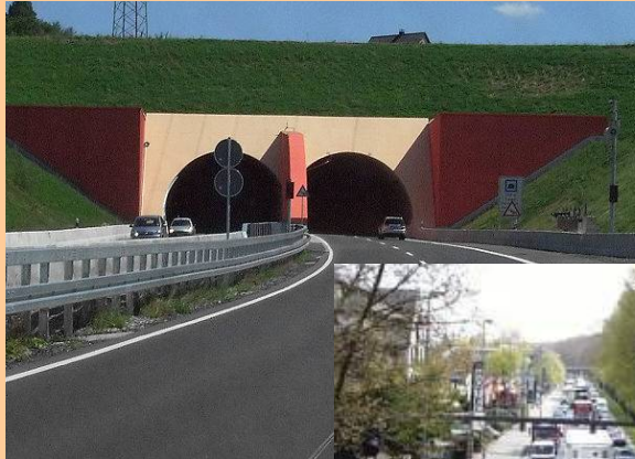
Neubau der B 236n bis Stadtgrenze Schwerte