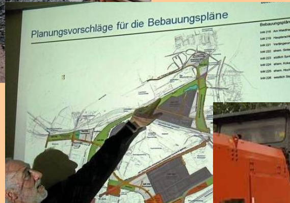
Ost-West-Verbindung Westfalenhütte (Nordspange)