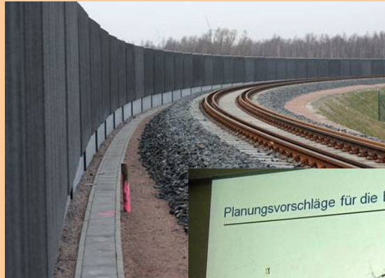
Bau von Schallschutzwänden an Bahntrassen des Bundes