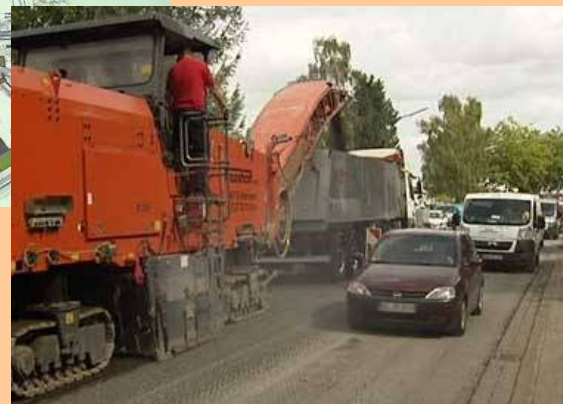
Verstärkter Einbau lärmoptimierten Asphalts