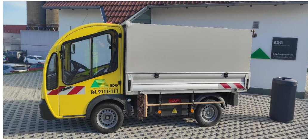
Elektrofahrzeug Papierkorbleerungen Innenstadt (Einzelposten, 2 Fahrzeuge im Einsatz pro Schicht)

Zusatzmodul der Intensivierten Innenstadtreinigung: Fahrzeug- und Gerätesressourcen: