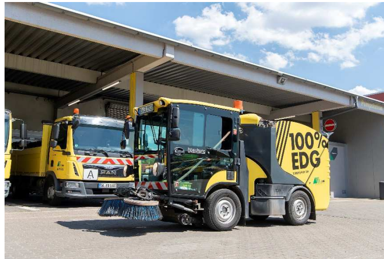
Elektrokleinkehrmaschine (exemplarisch) (1 Fahrzeug, Einsatz in allen 4 Reinigungsrevieren)

Zusatzmodul der Intensivierten Innenstadtreinigung: Fahrzeug- und Gerätesressourcen: