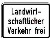
Zeichen 260 + 810