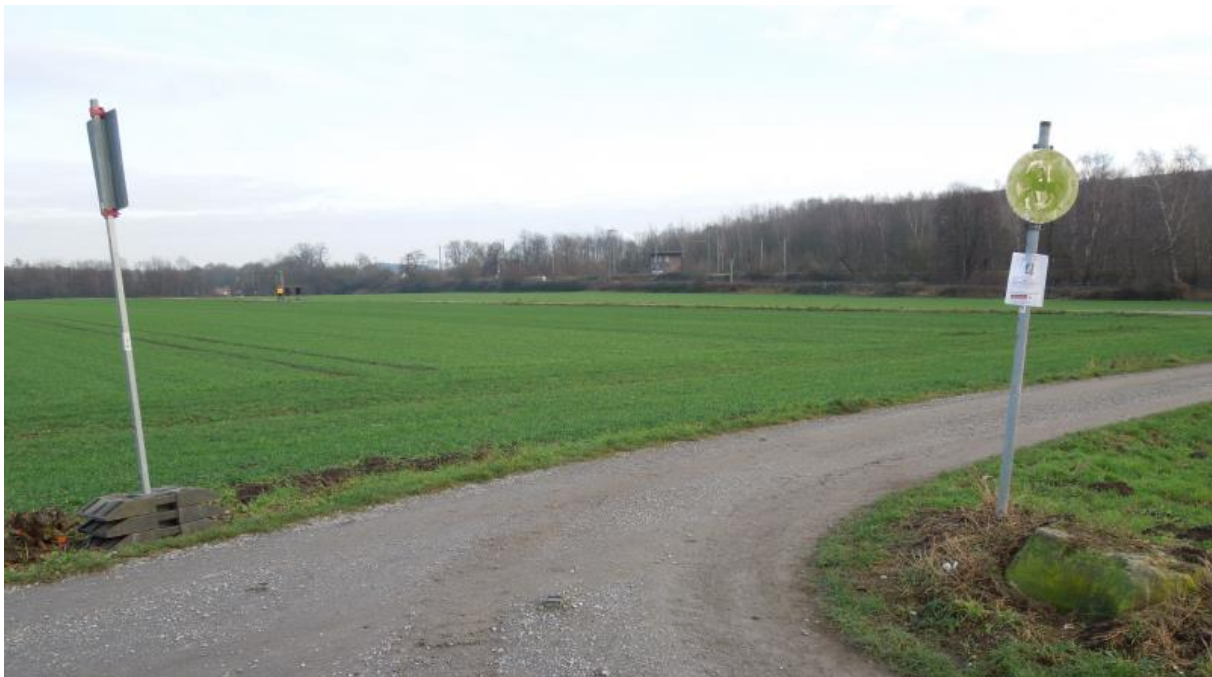
Situation am 10.1.2021