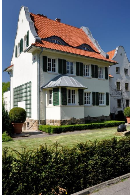
Abb. 1: Das denkmalgeschützte Haus in der Lübkestraße 8 zeigt mit seinen Farben und architektonischen Details wie viele Häuser in der Gartenstadt ursprünglich gestaltet waren.

Pressestelle der Stadt Dortmund Frank Bußmann (verantwortlich) Südwall 21–23, 44122 Dortmund Telefon: +49 (0)231/50-2 21 34 Telefax: +49 (0)231/50-2 21 67 E-Mail: pressestelle@stadtdo.de Web: dortmund.de/presse dortmund-ueberrascht-dich.de