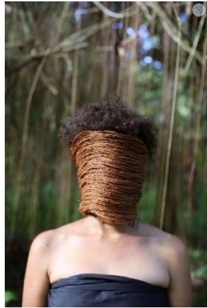
Lisa Hilli: In a Bind 2015, Pigmentdruck, Maße variabel

HIER UND JETZT! DIE SAMMLUNG HORN ZU GAST IN DORTMUND