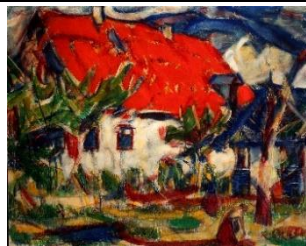
Christian Rohlf: Haus in Soest

1916, Tempera auf Leinwand, 100 x 120 cm