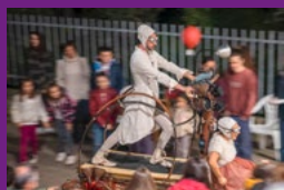
Klak stories for artists