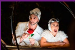
Klak stories for artists